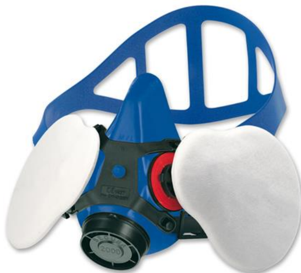
SECURA 2000 A